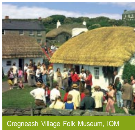
Cregneash Village Folk Museum, IOM

Sat 8.10.05 >> departure / départ / salida