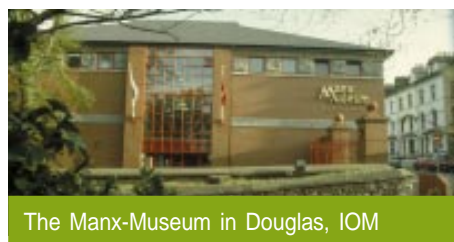
The Manx-Museum in Douglas, IOM

The conference will be held from 3 rd to 7 th October 2005. All ICR members are kindly invited to participate with papers.