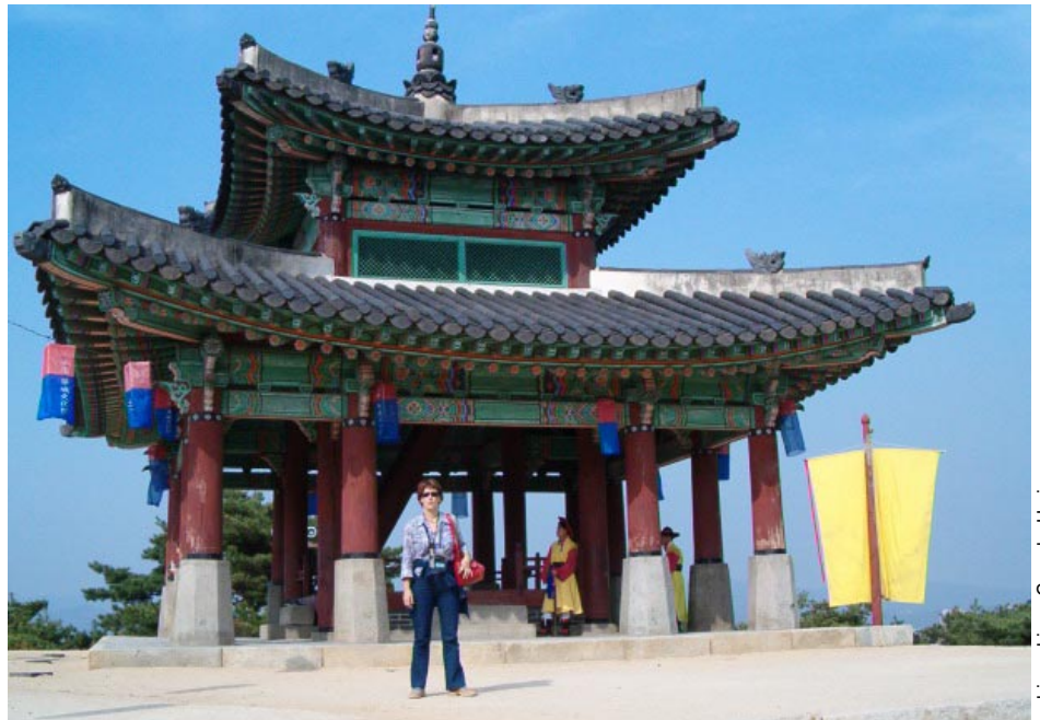
Day out on the Annual Conference: Goranka Horjan in front of a famous UNESCO site fortress