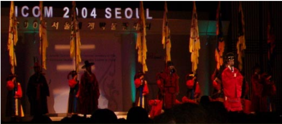
Opening ceremony of the ICOM General Conference in Korea with traditional elements

certainement aux qualités humaines les plus profondes et touche également le domaine de l'immatériel.