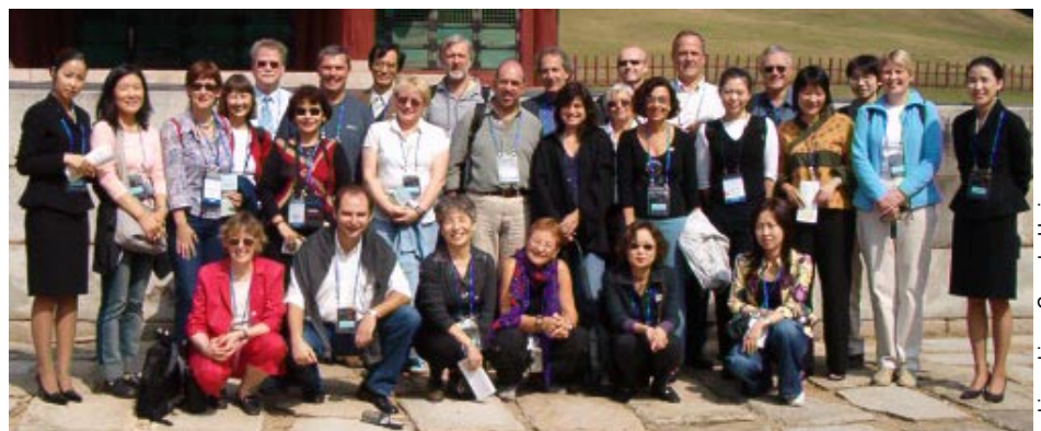
The whole ICR group with the hosts on their day out