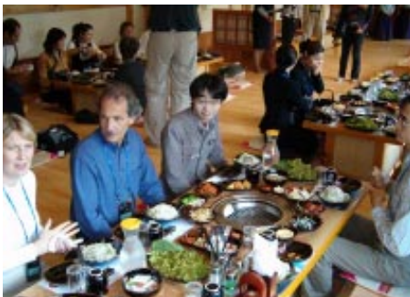
ICR members in a typical Korean restaurant

The annual ICR conference in Korea has been concluded with a lot of wonderful papers and discussions. We have heard there many useful reflections on the main theme of regional development and intangible heritage by our keynote speakers, excellent examples of intangible heritage from Korea that enabled us to have a glimpse into this rich heritage and culture that we would like to know more about. Pansori tradition, Sunbi people, tea ceremonies, local festivals and customs are traditions that many of us encountered for the first time in this beautiful and hospitable country. Extensive educational programmes and events for local community as well as for foreign visitors, together with performing arts that showed us the fascinating world of the intangible heritage, prove that Korea is a great place to explore the conference theme.