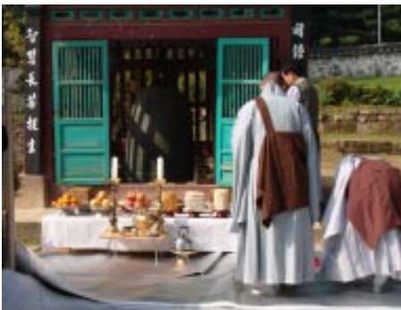
Visit in a buddhism temple

La conférence annuelle de l'ICR en Corée a été clôturée par une multitude d'exposés prestigieux et de discussions intéressantes : de nombreuses réflexions très utiles sur le thème phare du développement régional et du patrimoine immatériel dans le cadre des exposés principaux, d'excellents exemples de patrimoine immatériel en Corée. Ils nous ont permis d'avoir un aperçu de ce riche héritage et de cette culture qui nous donnent envie d'en savoir plus. La tradition